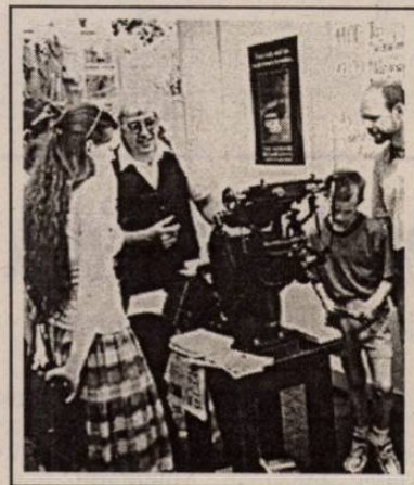
A kézynomda és nyomdása a tér kuriózuma